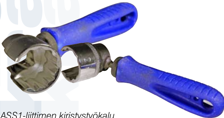
ASS1-liittimen kiristystyökalu Til.nro: 10-W180-007

Liitintä ei saa riittävän kireälle käsivoimin — jonkinlainen työkalu on pakollinen asennuksessa. Aspöckiltä on saatavissa työkalu ASS1-liitinten kiristykseen.